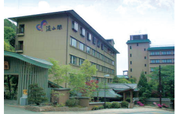
おもてなしの宿 溪山閣 外観

■利用予定ホテル/ 京都・亀岡・湯の花温泉 おもてなしの宿 溪山閣 TEL. 0120-417-004